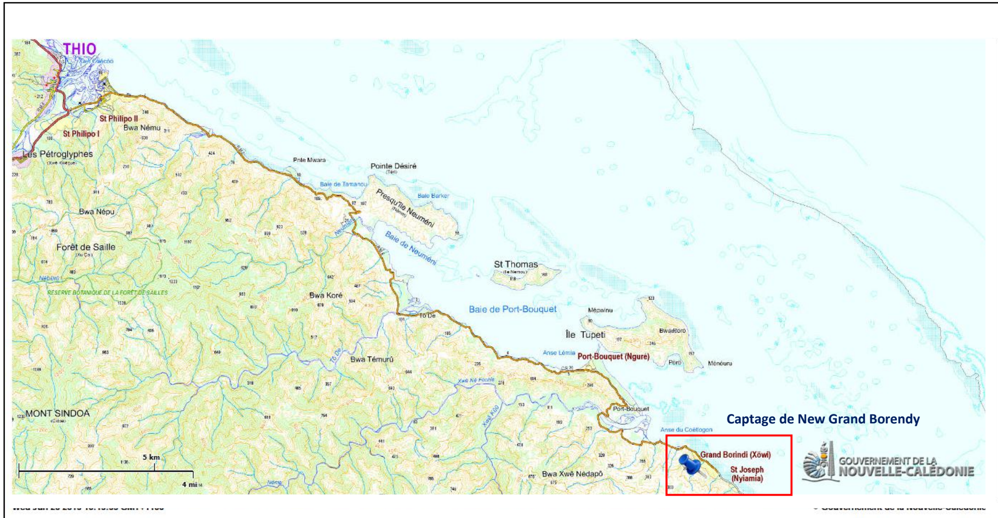
Figure 1 : Plan de situation du captage de New Grand Borendy